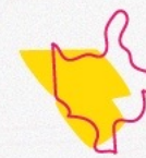
El mapa de @finajosefina