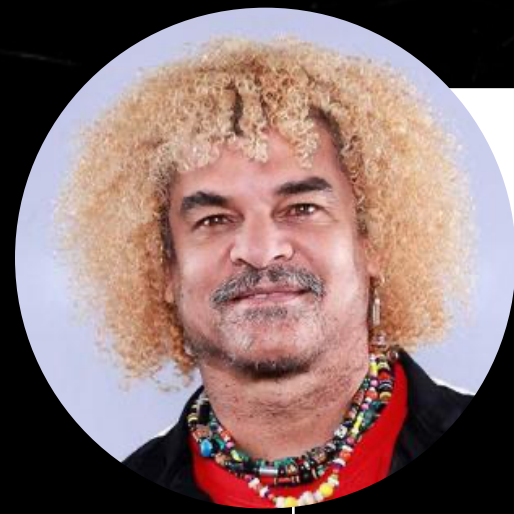
PIBE VALDERRAMA - EX SELECCIONADO DE COLOMBIA

ENVÍAMOS NUESTROS PACKS A PERSONAJES IMPORTANTES DEL MUNDO DEPORTIVO DE PAÍSES DONDE NO CLASIFICARON AL MUNDIAL PARA LLAMAR LA ATENCIÓN DE LOS MEDIOS INTERNACIONALES.