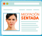
MENSAJE DE WAKE UP